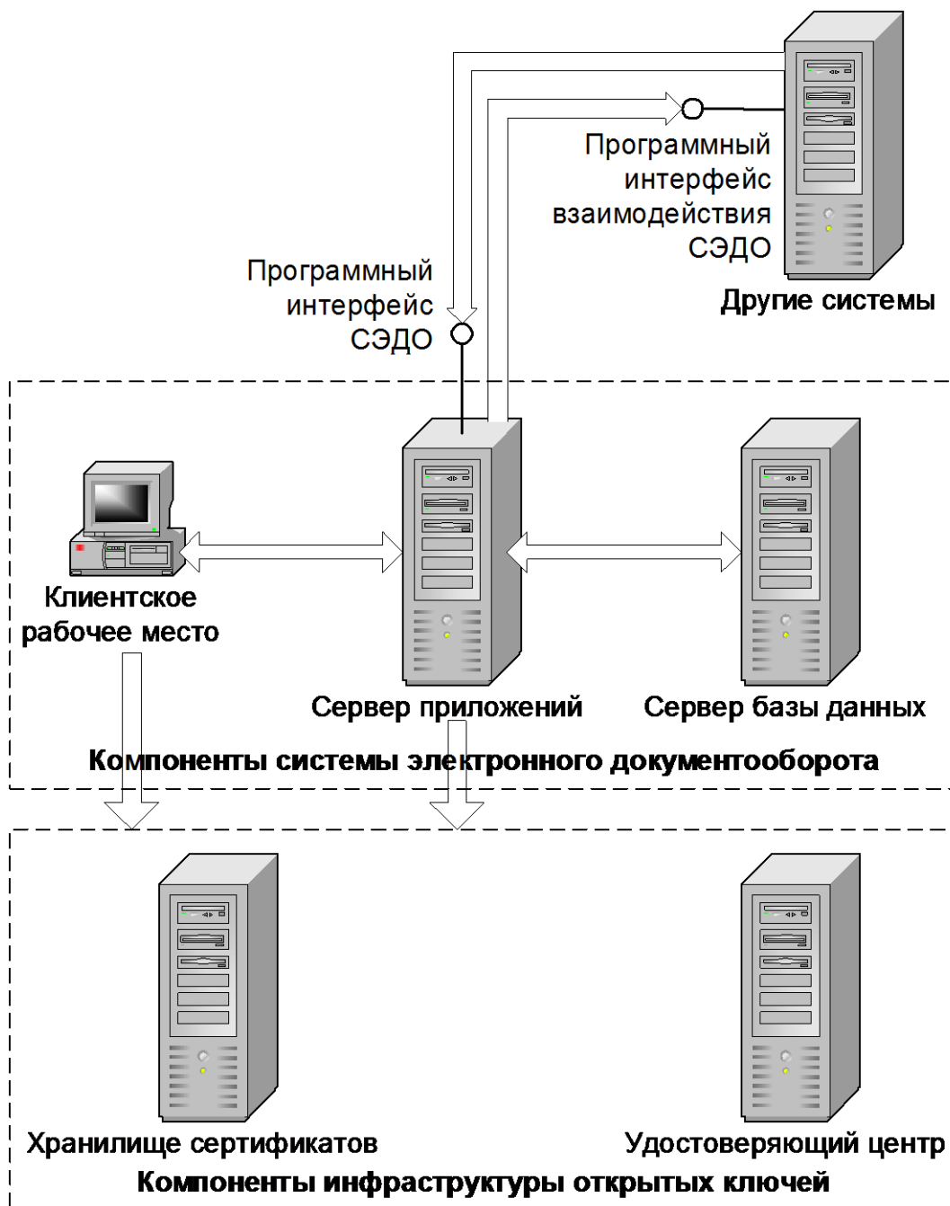
Слайд № ____ - Компонентная архитектура системы

Для обеспечения выполнения функций электронной цифровой подписи, компоненты системы электронного документооборота взаимодействуют с компонентами инфраструктуры открытых ключей.